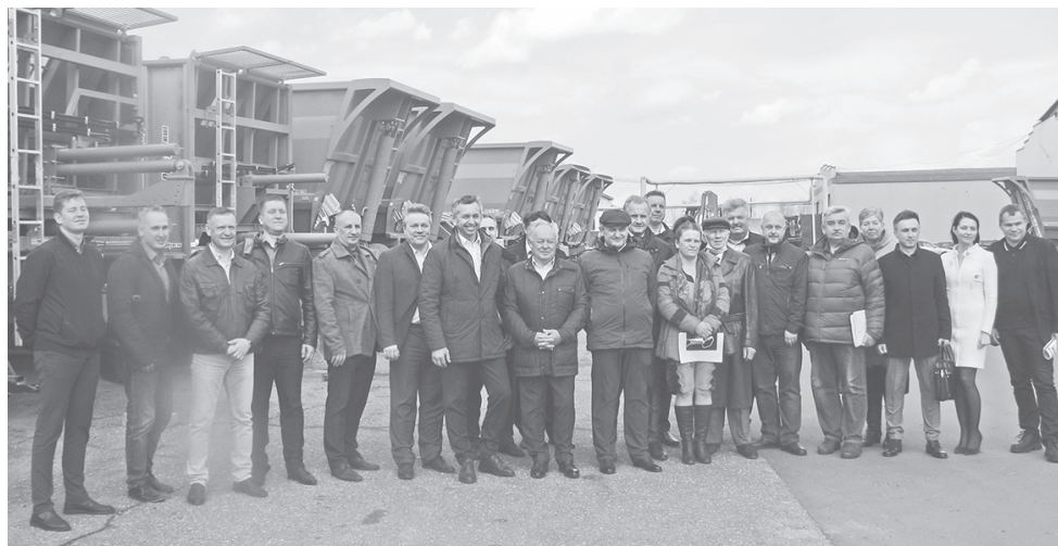
Участники Агросовета ЯМР на площадке готовой продукции АО «Производственная компания «Ярославич»