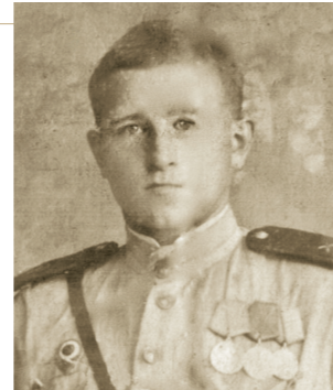
победу над Германией» (1945 г.)

Награжден медалями: «За отвагу» (1943 г.), «За боевые заслуги» (1944 г.), «За отвагу» (1945 г.), «За